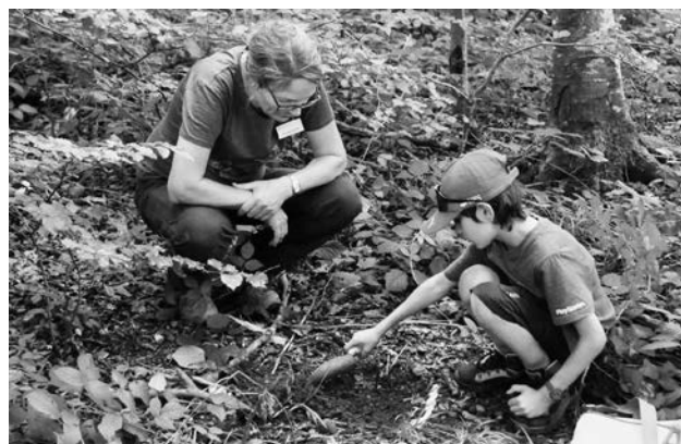
Wie lebt der Maulwurf?

wozu der Regenwurm seine "Haare"? Finden Sie es heraus! Anmeldung bis Montag, 22. Juni 2026 (die Teilnehmerzahl ist beschränkt).