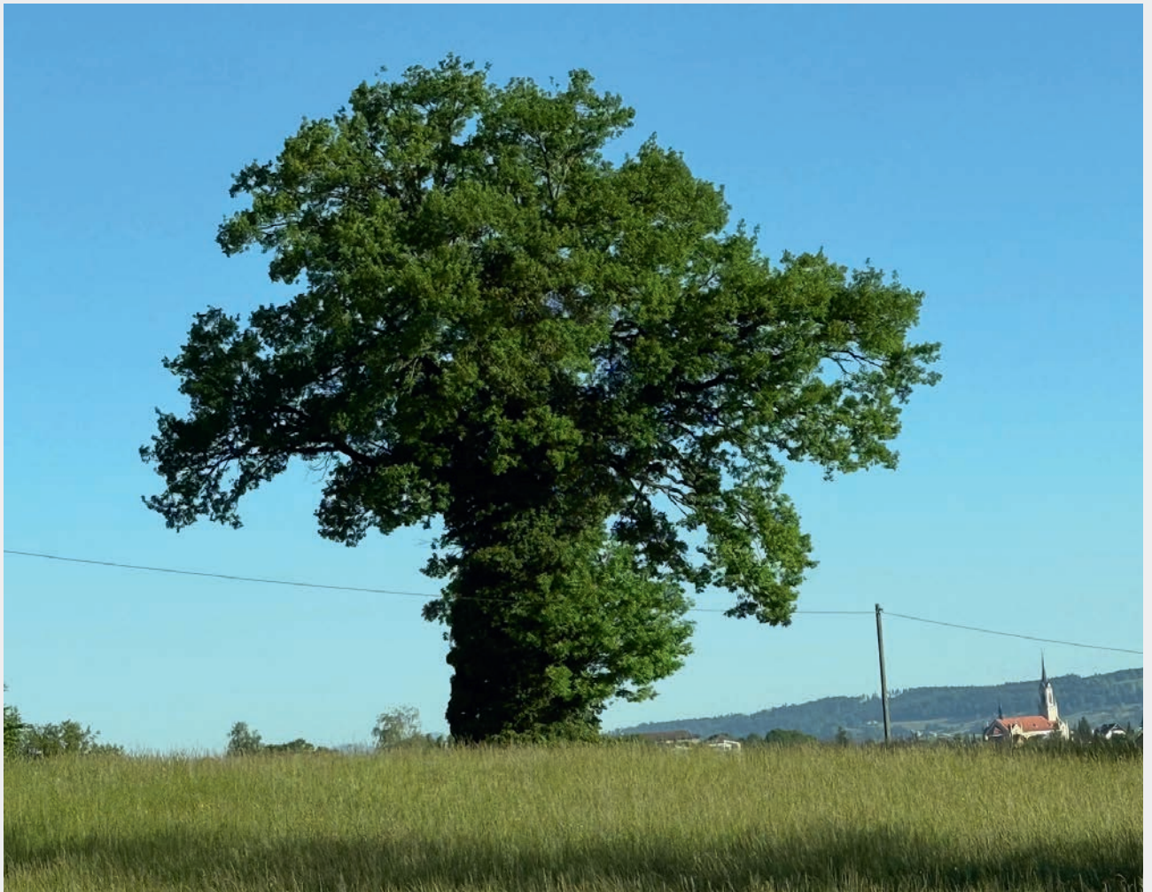
Blick vom Waldheim. Im Vordergrund über hundert Jahre alte Eiche. Rechts Kirche Grosswangen.

Offizielles Mitteilungsblatt der Gemeinde Grosswangen