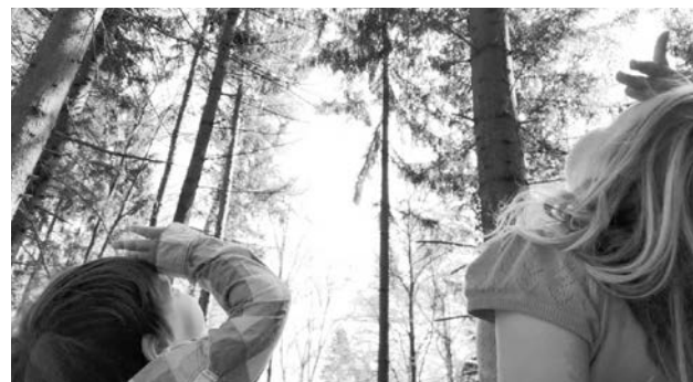
Beobachten, spielen und forschen mit der Kindergruppe NaturNetz Region Willisau

Der Verein NaturNetz Region Willisau startet im Sommer 2026 mit der Kindergruppe. Gemeinsam mit dem Maskottchen Chlopfi, dem Buntspecht erleben, entdecken, forschen und spielen die Kinder draussen in der Natur. Anlässlich des Starts der Kindergruppe organisiert der Verein einen Schnupperanlass. Dieser findet am Sonntag, 31. Mai 2026 von 13.30 bis 16.00 Uhr im Naturlehrgebiet Buchwald in Ettiswil statt. Am Schnupperanlass lernen die Kinder den Buntspecht Chlopfi, die Leiterinnen und Leiter und verschiedene Aktivitäten kennen. Jetzt Datum reservieren und vorbeikommen.