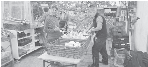
Beim Packen der Gemüsetaschen

Wie bereits im April Wangerblättli angekündigt, öffnen wir am Samstag, 2. Mai 2026 in Rüzligen und Brestenegg 5 (Ettiswil) unsere Gärten und das Gewächshaus.