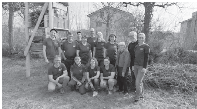
(G)Arten-Coaches der Regionalgruppe Rottal – Hinterland

Anmeldung für ein Coaching unter www.garten-vielfalt.ch/coaching oder Tel. 041 226 41 32 (werktags von 10.00 bis 11.30 Uhr).