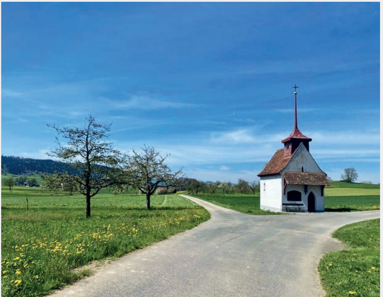
Blick zur St. Anna Kapelle – Kreuzung Sonnenhof und Stockmatt Richtung Ettiswil.

Offizielles Mitteilungsblatt der Gemeinde Grosswangen