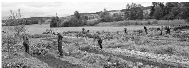
Gemeinsames Arbeiten im Garten

Seit sechs Jahren bauen wir in Rüzligen und in Ettiswil Gemüse für und mit unseren Mitgliedern an. Das gemeinsame Gärtnern ermöglicht viele schöne Begegnungen an der frischen Luft und gleichzeitig können alle miterleben, wie ihr Gemüse, welches später auf dem eigenen Teller landet, gedeiht; direkt vom Garten zu den Mitgliedern.