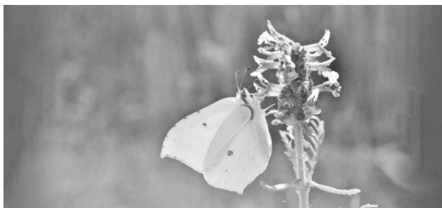
Leuchtender Zitronenfalter auf Nektarsuche

Sie flattern wieder und erfreuen Gross und Klein: Die ersten Schmetterlinge. Besonders auffallend ist in diesen Tagen der Zitronenfalter. Das Männchen leuchtet mit seinen zitronengelben Flügeln besonders in der sonst eher noch kargen Gegend. Haben Sie auch schon einen entdeckt? Der Zitronenfalter gehört zu jenen Schmetterlingen, welche als vollständig entwickeltes Insekt überwintern. Deshalb gehören sie im Frühling zu den ersten, die herumflattern. Die Mehrheit der Schmetterlinge überwintert als Puppe, Raupe oder Ei und müssen sich dann zuerst noch fertig entwickeln.