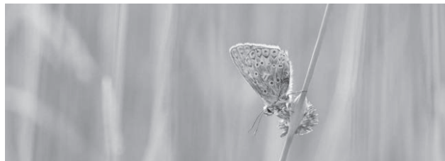
Foto: Ein attraktiver Bläuling sitzt in der Wiese. Welcher Art er angehört und wie er lebt wird Bestandteil des Grundkurses sein.

Nachtexpedition oder einen Besuch beim Maulwurf und seinen Freunden. Zudem wird in Zusammenarbeit mit dem Verein NaturNetz Region Willisau einen Grundkurs für Tagfalterinteressierte durchgeführt.