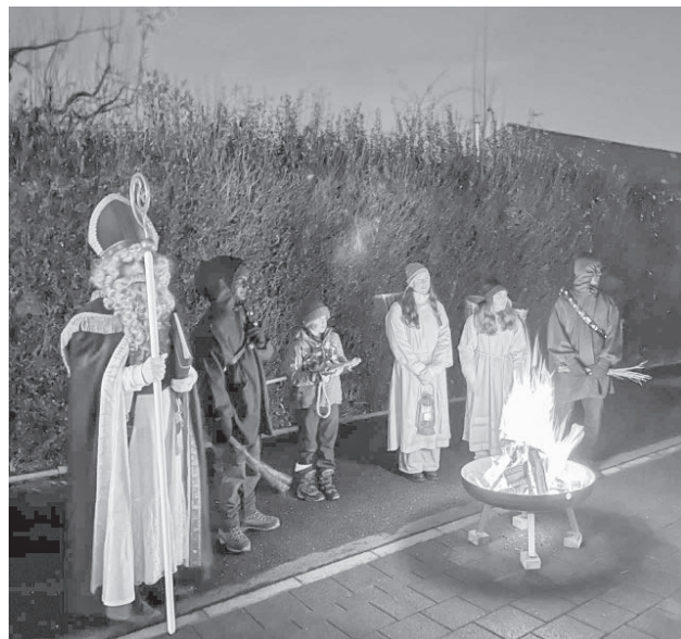
Bereit für eine Geschichte und eine herzliche Begegnung.

Wir danken allen Familien herzlich für die Einladungen, das Vertrauen, die schöne Gestaltung der Besuche im Freien und die finanzielle Unterstützung. Die Chlausgruppe hat wieder viel Freude und Wohlwollen erlebt. Über Rückmeldungen freuen wir uns jederzeit via praesident@chlausgruppe-grosswangen.ch .