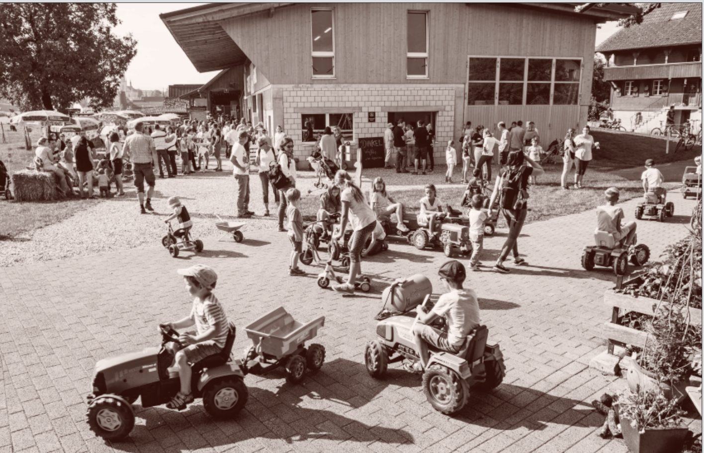
Vo Buur zo Buur, Foto: Roger Dula

Offizielles Mitteilungsblatt der Gemeinde Grosswangen