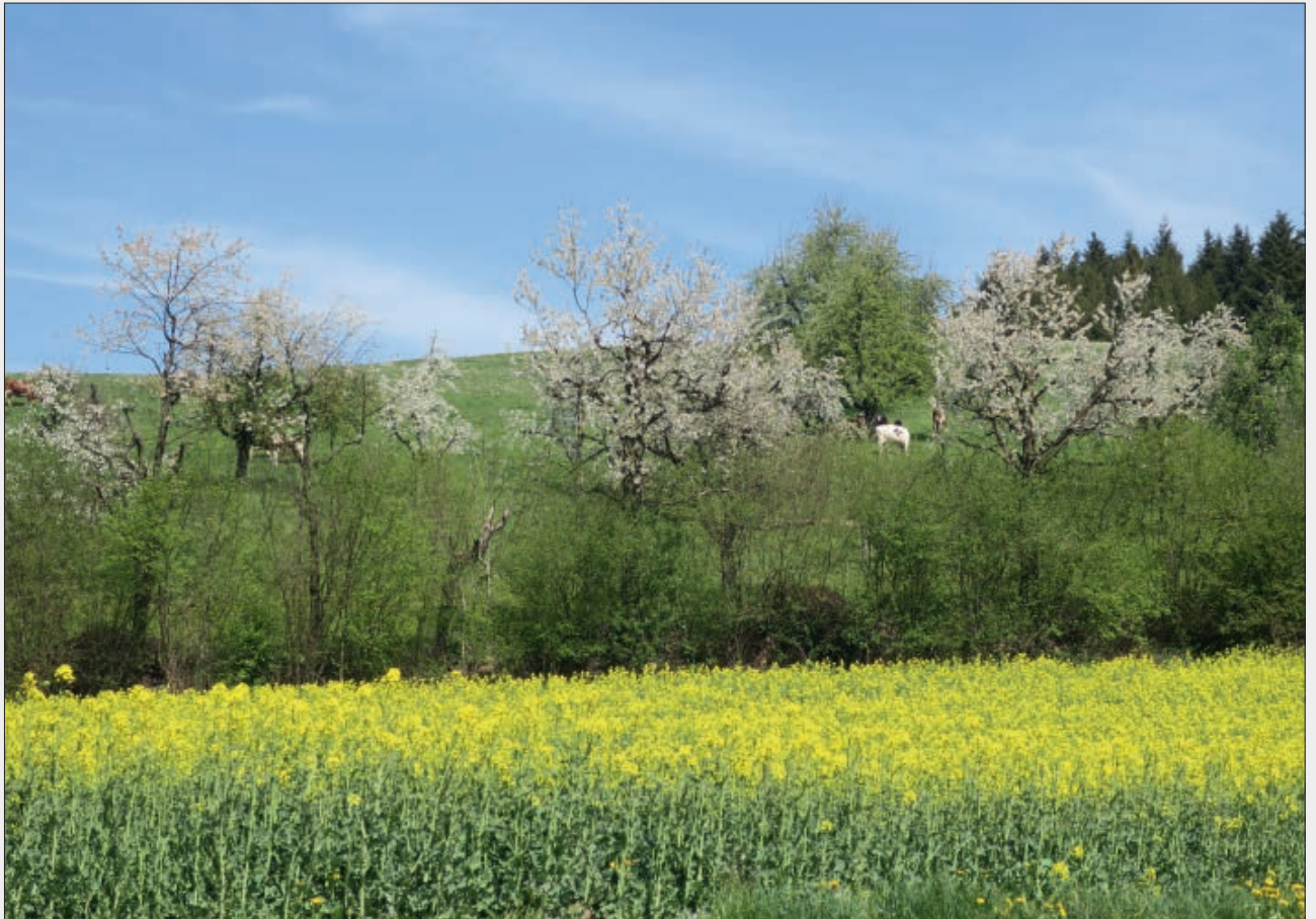
Ausblick vom Willberg.

Offizielles Mitteilungsblatt der Gemeinde Grosswangen